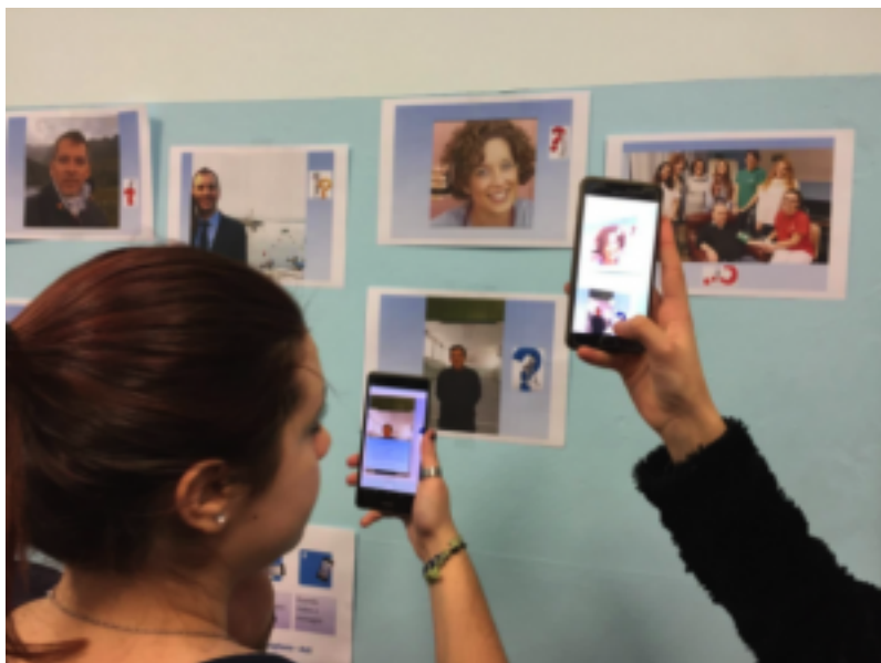
Figura 2 – Gli studenti provano il percorso di AR.

Partendo da un obiettivo concreto da portare a termine, con una buona dose di entusiasmo, hanno condotto l'attività con impegno per il desiderio di verificare come avrebbero reagito gli stessi docenti quando fossero stati invitati e scoprire il percorso di AR da essi realizzato.