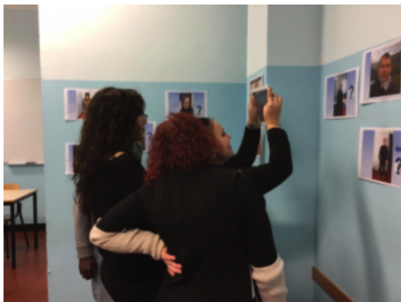
Figura 3 – Open School del 28 gennaio 2017, Visitatori.

In occasione della presentazione grande è stata l'emozione dei ragazzi così come la curiosità di docenti e visitatori che si avvicinavano ad un mondo nuovo un po' per tutti.