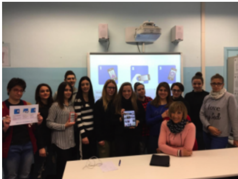
Figura 1 – Gli studenti che hanno realizzato il percorso di AR

Abbiamo sperimentato Aurasma nelle due modalità: programmatore e utente . Come programmatori gli studenti hanno inserito contenuti virtuali sovrapposti al mondo reale che tutti gli utenti possono guardare attraverso il proprio smartphone o tablet.