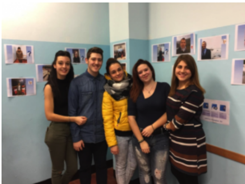
Figura 5 – Un gruppo di studenti sviluppatori in occasione dell'Open school – 28/01/17.

L'esperienza ha richiesto grande impegno e molte ore di lavoro e ha attraversato momenti di demotivazione di fronte a situazioni inattese, a problematiche tecniche sulla piattaforma, a volte dovute a situazioni temporanee o a inadeguata velocità di rete.