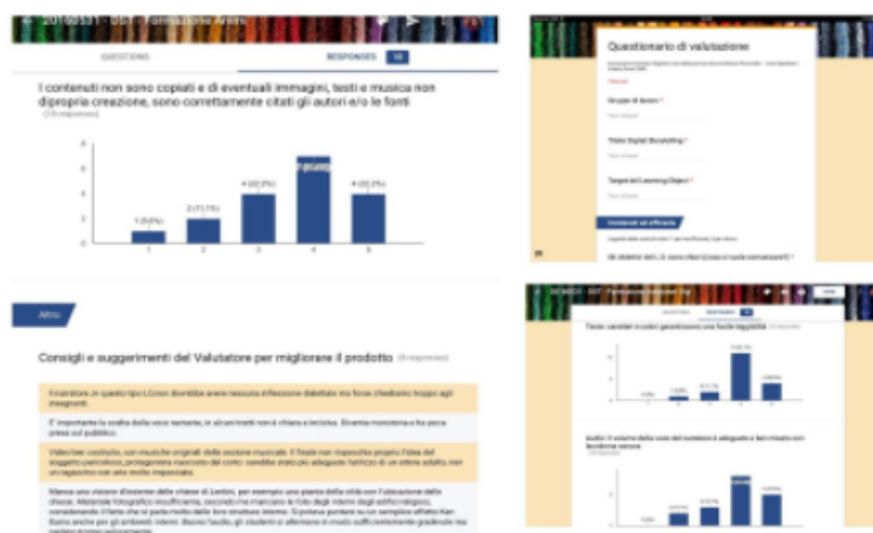
Figura 1 – Screenshot da un modulo Google usato nel lavoro di gruppo sul Digital Storytelling

Prima di accingersi a creare i propri Digital Storytelling (DSt) e scegliere i tools più adeguati alle loro esigenze didattiche, i partecipanti ne hanno analizzati alcuni in gruppo, applicando i parametri di un modulo Google i cui risultati sono mostrati in alcune schermate della figura 1.