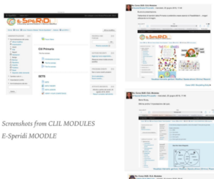
Screenshots from CLIL MODULES E-SpeRiDi MOODLE

La schermata sottostante mostra due prototipi di corsi CLIL: uno per la scuola primaria e uno per la secondaria di primo grado con i relativi commenti della tutor.