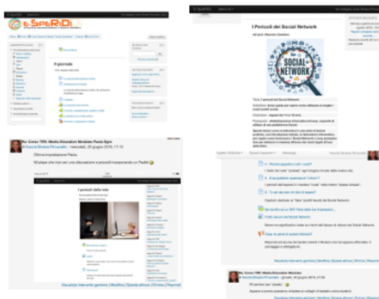
Figura 5 – Screenshots dai Moduli di Media Education su E-SpeRiDi Moodle

La schermata mostra tre screenshot da altrettanti corsi implementati su E-SpeRiDi dagli AD. Il primo in alto è impostato in modo tradizionale a cominciare dall'origine della stampa mobile ed è corredato di attività per studenti di scuola Media, gli altri due, sui pericoli della rete e dei social network, presentano attività per studenti dai 14 ai 18 anni.