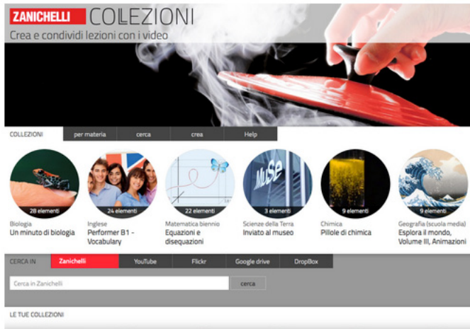
Figura 2 – La Home Page di Collezioni, il nuovo ambiente online per creare percorsi di lezione con video, slides e risorse personali.

Collezioni ( collezioni.scuola.zanichelli.it ) si costruiscono lezioni multimediali scegliendo tra i 1.000 video forniti da Zanichelli, con la possibilità di aggiungere altri video e foto scaricate dalla rete, e slide scritte dal docente. I corsi sono gratuiti e si tengono sulle piattaforme online Edmodo o Moodle.