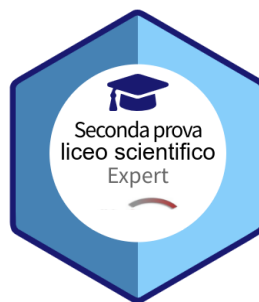
Figura 3 – Badge creato con Accredible badge builder

Esistono siti gratuiti che permettono di creare immagini "professionali" del badge da caricare (Figura 3), ma si possono scegliere anche immagini già pronte e disponibili su internet.