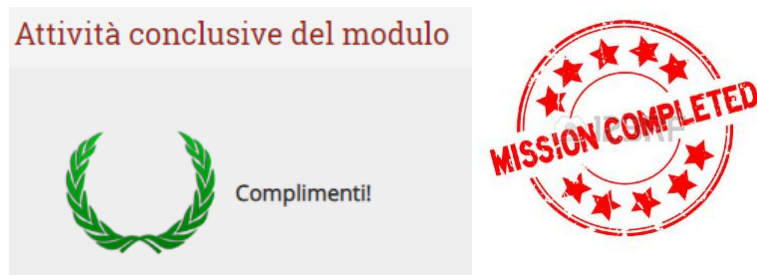
Figura 2 – possibili etichette di fine modulo