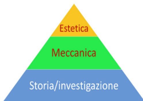
Figura 4 – Schema del modello SMA

Come appena visto, Moodle supporta egregiamente lo sviluppo delle principali meccaniche del gioco (M), ma la parte più importante nella gamification è la storia (S): la trama del gioco/percorso. Ultima viene l'estetica ( Aesthetics ), che rappresenta la classica ciliegina sulla torta, quella che rende gradevole e più attraente il gioco. Usare il modello piramidale SMA ( Story-Mechanics-Aesthetics ) è utile per dare il giusto peso ai vari aspetti del percorso gamificato che si vuole progettare: troppe volte si curano immagini, colori ed app scenografiche col rischio di limitarsi a trame di base approssimative, insipide e poco coinvolgenti.