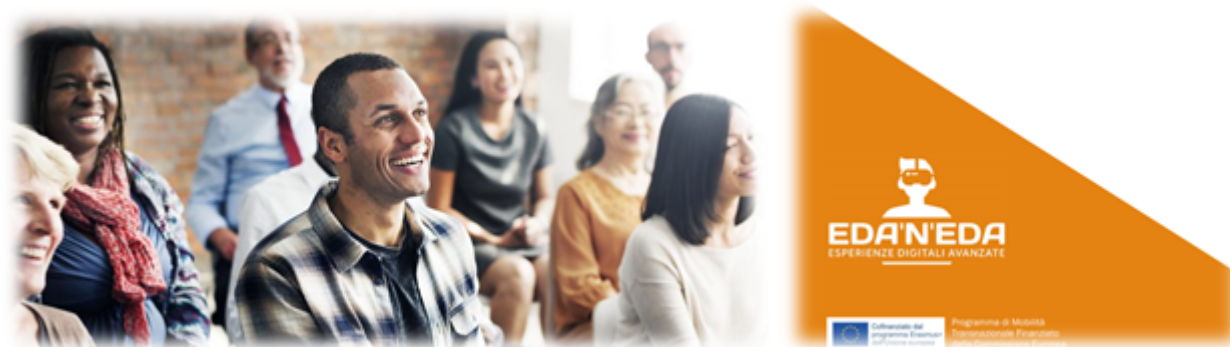
Figura 2 - Mobilità per l'apprendimento – KA1 | Erasmusplus

I beneficiari e destinatari dei vari interventi previsti dal progetto, siano essi CPIA che Uffici scolastici regionali ecc., avranno il compito di valorizzare le competenze acquisite grazie alla partecipazione alle attività formative previste dal progetto EDA'n'EDA, attraverso azioni che garantiscano un'effettiva ricaduta all'interno dell'ente di appartenenza e nei confronti delle comunità locale.