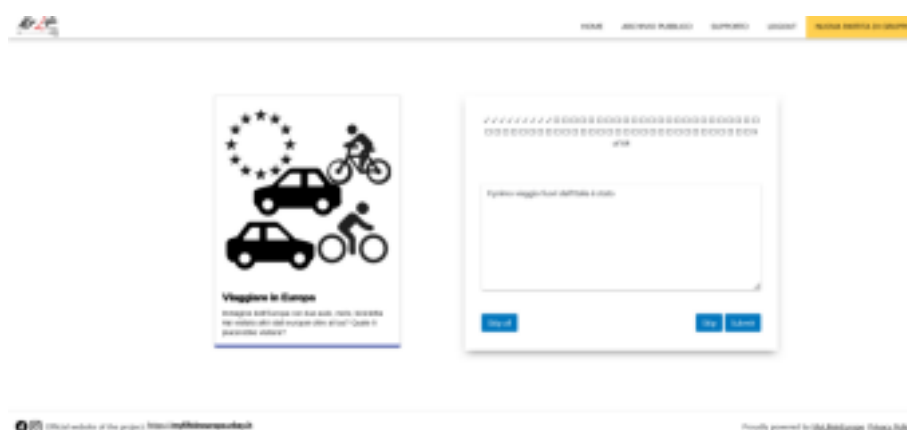
Figura 2: MyLIFE – The Game: visualizzazione di una carta e inserimento del testo

Quando un giocatore si trova davanti una carta la osserva nelle sue componenti, può chiudere gli occhi, se vuole, e lasciare che la sua mente viaggi liberamente, in un percorso che lo riporta alle sue esperienze passate, a ciò che era e che ha vissuto e lo fa riflettere sul significato che queste esperienze hanno avuto per lui/lei: questa riflessione diventa lo spunto per il contributo da inserire in corrispondenza della carta.