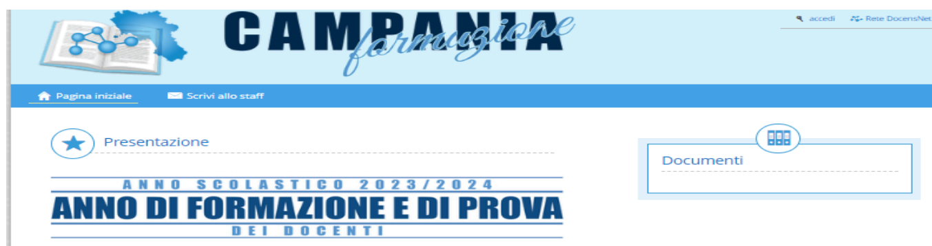
Immagine 1 - Home page del portale docens net

La procedura per le iscrizioni è gestita dal polo regionale IS Torrente di Casoria attraverso il portale docensnet.